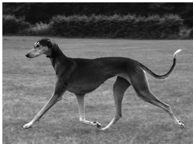
CH Yazarah Sawahin, Germany's #1 Saluki 2003 (Show+Coursing)