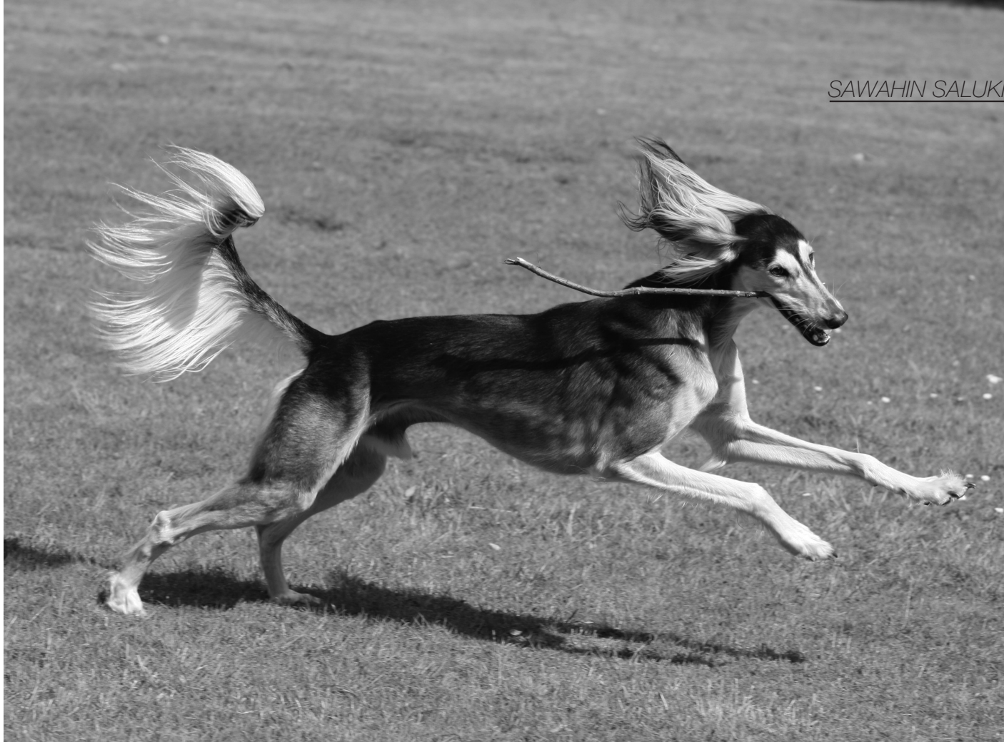
CH Brahmani Sawahin

alcuni saluki vadano a caccia quando lasciati senza guinzaglio. Allenarsi senza guinzaglio è molto restrittivo nella maggior parte dei paesi europei, ma a molti proprietari di saluki piace rischiare per tenere in allenamento i propri cani in funzione dei bisogni della razza. Queste problematiche le ho ampiamente trattate nella presentazione, sopra menzionata, al Congresso Mondiale dei Levrieri, a Bruxelles, nel 2002; ed anche in un mio intervento sul "Saluki Activities" al Congresso Mondiale del Saluki ad Helsinki, nel 2008.