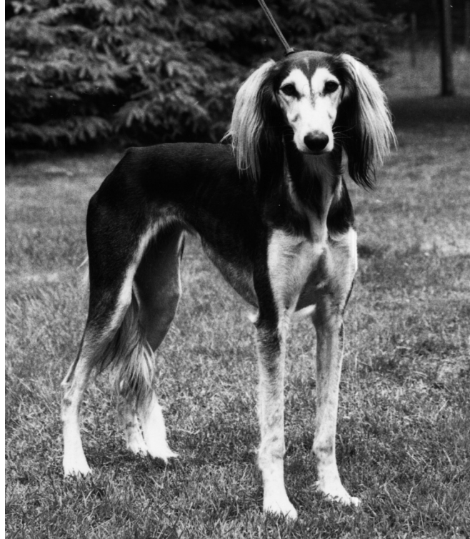
CH Chirica Sawahin, Germany's #1 Saluki 1983

Quindi coloro che sono interessati al racing o al coursing in Germania, per molti anni hanno cercato un cucciolo rivolgendosi a quegli allevatori che allevano da saluki importati dai paesi d'origine. A causa delle difficoltà sopra menzionate, circa la possibilità di avere un purosangue direttamente importato, l'attenzione dei proprietari interessati alle attività sportive con i levrieri, è attualmente concentrata sulla discendenza delle importazioni dirette. I saluki provenienti dai paesi d'origine sono denominati "Imp-S-0-pedigree", lo chiamiamo "import pedigree". "0" significa che nessuno degli antenati, anche se noti, viene riconosciuto dalla FCI. Alla loro discendenza, viene poi attribuita la sigla "Imp-S-1-pedigree", e ancora alla rispettiva discendenza la sigla "Imp-S-2-pedigree". Solo quando un saluki nasce da un esemplare "Imp-S-3-pedigree", l'abbreviazione "Imp" e il numero dietro la "S" che sta per saluki, scompare dal pedigree. Ciò significa che questa discendenza non risulterà più di importazione,