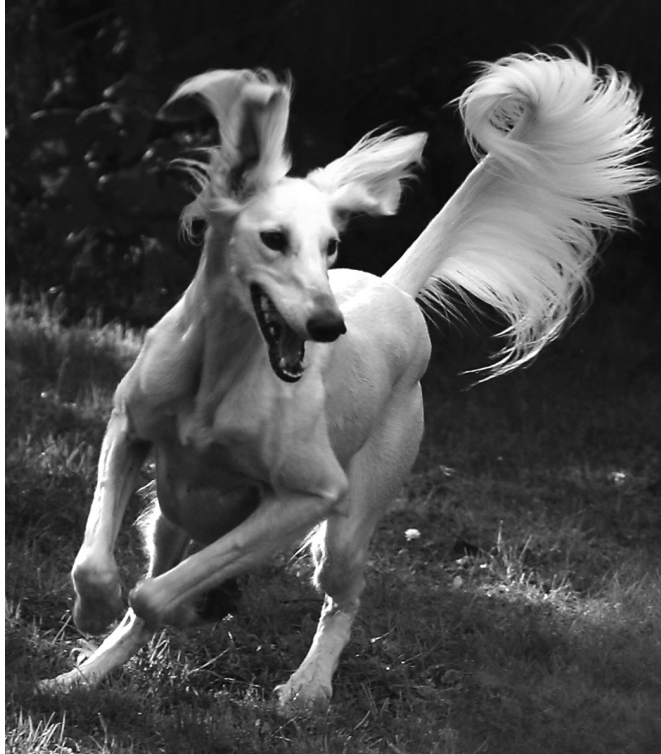
CH Daklira Sawahin running

Così il numero delle importazioni in Germania è diminuito drasticamente.