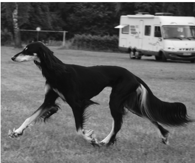
CH Tashari Sawahin, Germany's #1 Saluki 1999+2000 (Show)