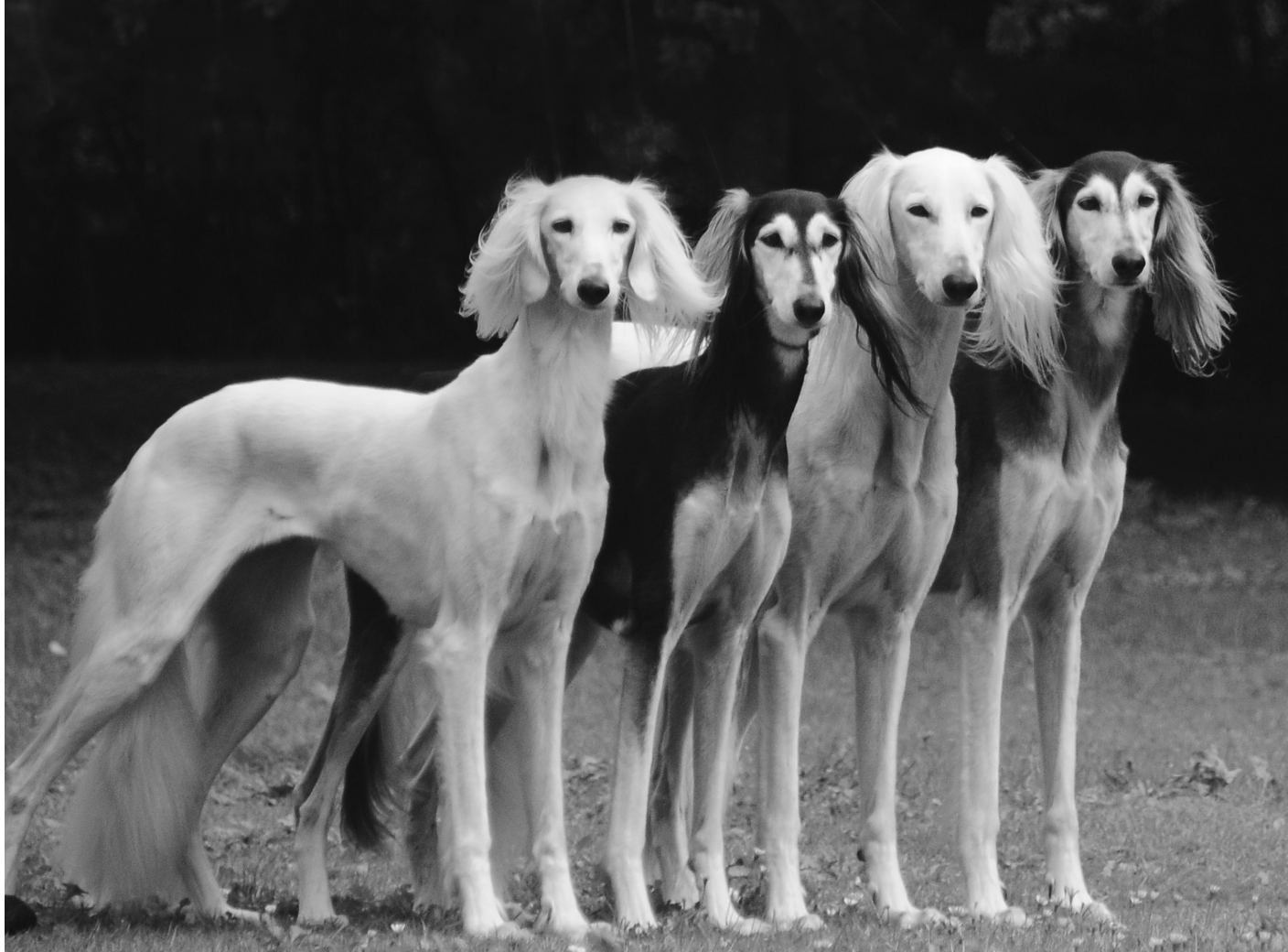
CH Dakira Sawahin, CH Karob Cyrene Keokeo of Sawahin, CH Chaliman Sawahin, CH Brahmani Sawahin

adatte per i saluki affinché essi possano muoversi e soddisfare le necessità tipiche di questa razza. Un giardino di 500 mq non sarà sufficiente, né una passeggiata al guinzaglio, neppure un addestramento settimanale su una pista da corsa. I saluki devono poter correre liberamente senza guinzaglio ogni giorno. Dovrebbero avere un'area con una varietà di terreno per poter stimolare la loro intelligenza, abilità e resistenza. Altrimenti si trasformeranno fisicamente e mentalmente in veri e propri poltroni. In Europa centrale, non possiamo offrire ai nostri saluki, aree con animali da preda vivi, a causa delle leggi che lo proibiscono. Dobbiamo compensare come possiamo con il racing o coursing. Le attività sportive di corsa su pista o terreno, durano massimo 30 weekend per anno, ma un saluki dovrebbe potersi esprimere, per quello che effettivamente è, tutti e 365 giorni all'anno.