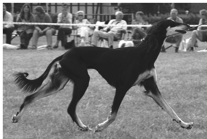
CH Chaakirah Sawahin

- Or does the Saluki always have to walk on the lead, at best beside