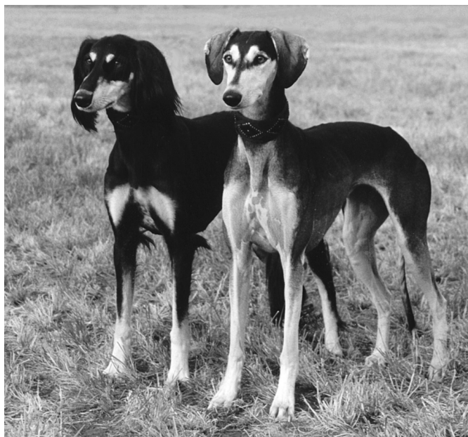
CH Villymona Sawahin, Germany's #1 Saluki 1999+2000 (Coursing)