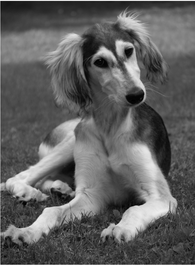
CH Brahani Sawahin, 18 weeks old, Germany's #1 Saluki 2005+2006 (Show)

Si fotografano i loro musetti, il profilo della testa, e, dalla quarta settimana alla decima, anche in piedi. Queste scatti settimanali e periodici richiedono grande pazienza. Dopo aver raggruppato tutte le immagini per testa, profilo e posizione in piedi, vengono posizionate su grandi tavole affinché tutti i cuccioli possano essere visti l'uno accanto all'altro secondo l'ordine di nascita. Ogni linea orizzontale rappresenta una settimana. In questo modo si riesce ad allenare, molto intensamente, le proprie abilità di osservazione e analisi delle diverse conformazioni.