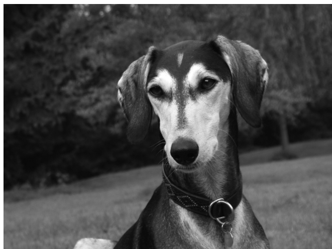
CH Xander Sawahin, Germany's #1 Saluki 2002 (Show)

One of our dogs has always taken on the role of father. I'd like to name CH Filimon Sawahin (CH Chiff Mumtachir-ar-rih - CH Chirica Sawahin) and especially our Smooth INT CH Lykaon Sawahin (CH Indra-Khan Sawahin - CH Zahra Du Zada of Conamor), but also INT CH Tassilo Sawahin (CH Magadha Nablous - CH Nirwana Sawahin), Smooth CH Xander Sawahin (Zaahin Tal Amal - CH Onnika Sawahin) and now my white boy INT CH Chaliman Sawahin (CH Urquija Sawahin - CH Rahima's Behrouz el Hor), even if they weren't the actual physical father. They all regurgitated their food to feed the puppies. In that way the Salukis organize daily educative games for the puppies making sure they get the socially most important training. In my opinion Salukis are absolutely not suitable to be kennelled as their highly differentiated psyche and behaviour distinguishes them from many other breeds and cannot develop properly if they are. You will not be able to experience the special qualities of the Saluki as a breed that shows particularly in their behaviour if the dogs are banned to a kennel. Salukis that spend their puppyhood and adolescence exclusively in kennels will tend to be shy to a much higher degree than puppies that grow up with direct human contact 24 hours a day.