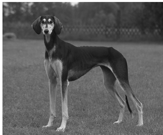
INT CH Phyllis Sawahin - 1994

CH Baghdad Look No Further, our 'Kangaroo', unfortunately had to be handed on at the age of 2 as he had become extremely jealous and aggressive towards our other males. We had used him twice before and fortunately the puppies were fine and had