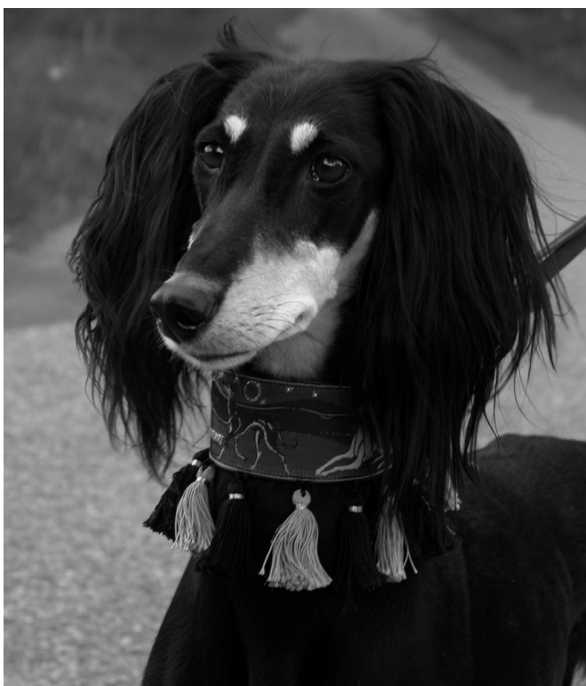
WW 2003 INT CH Walisha Sawahin

After the first live contact with this breed I had caught the Saluki virus and it took only a few days until I had my own Saluki.