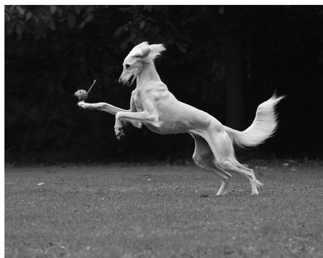
INT CH Dakira Sawahin - playing