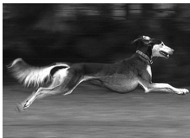
INT CH Tassilo Sawahin - 1996